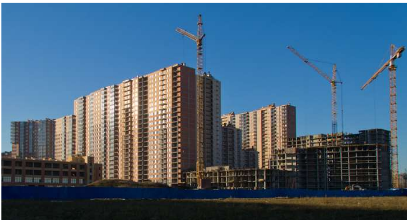
Вид со стороны Областной ул., секции 6-4, 35-34, 30-26, 25-22, 16-17, 18-19