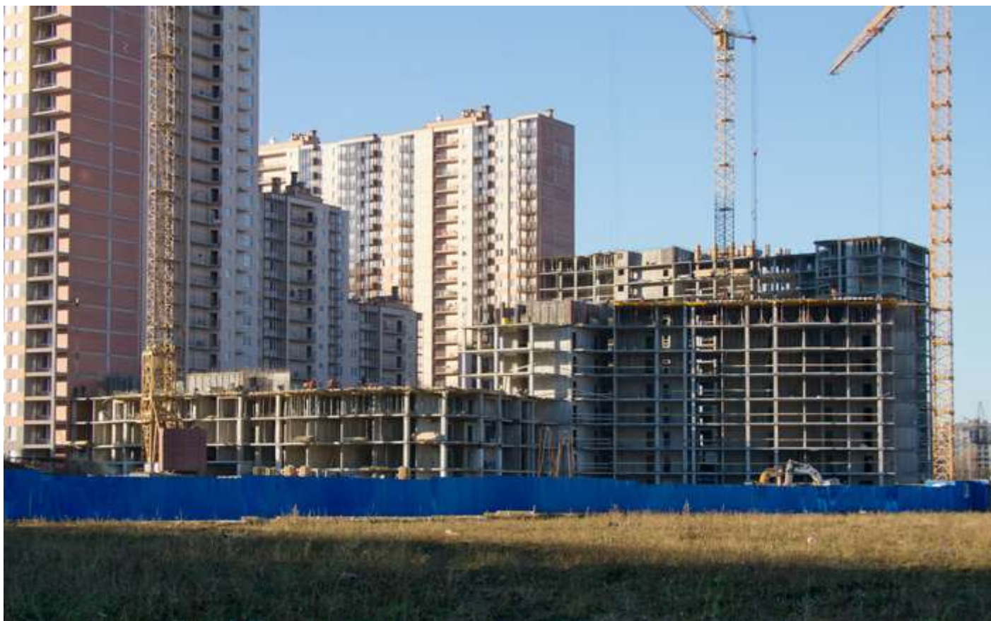
Вид с Областной ул. на секции 25-22, 18-19