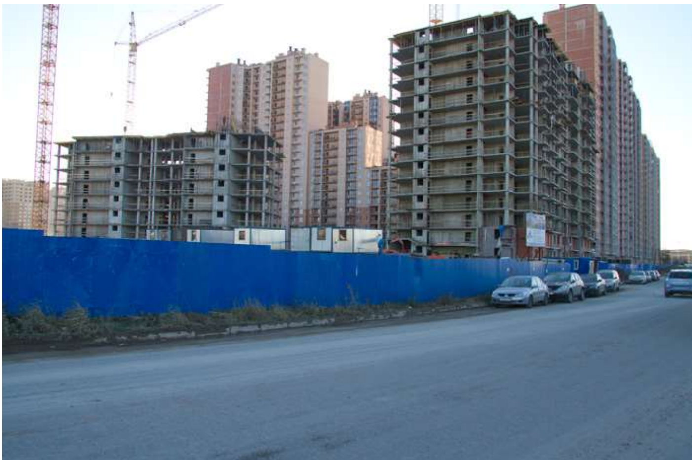
Вид с Областной ул. на секции 21, 19-18