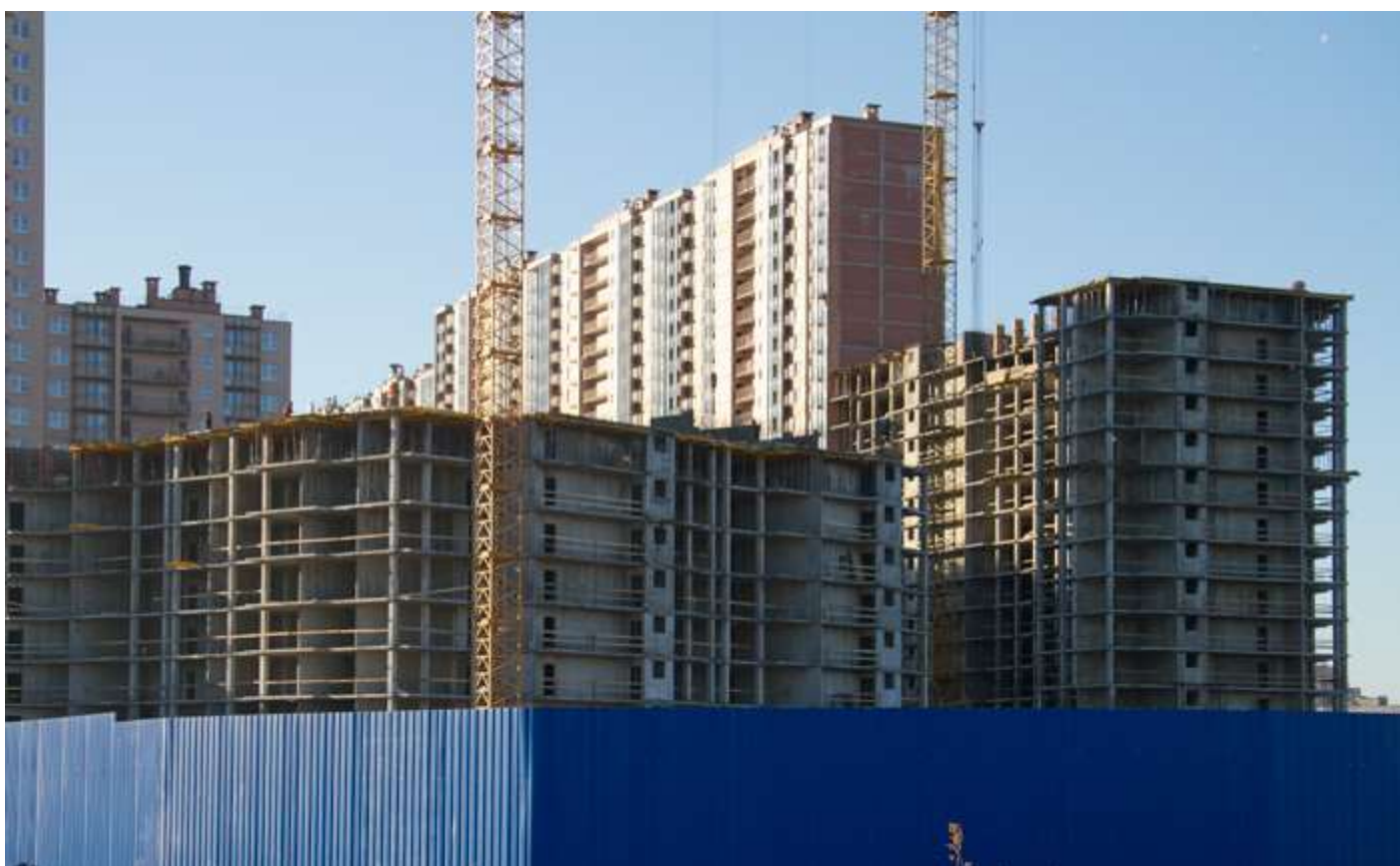
Вид с Областной ул., секции 22-21, 18-19