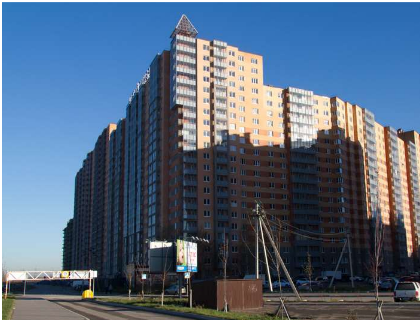
Вид с Областной улицы на секции (слева направо) 17-7